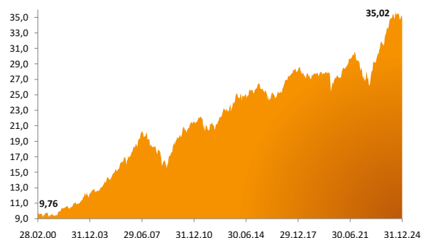
Rys.2 Wykres wartości jednostki rozrachunkowej PFE Nowy Świat

Założono: - średnioroczną stopę zwrotu Funduszu 5% - wielkość miesięcznej składki dodatkowej 50 PLN lub 100 PLN