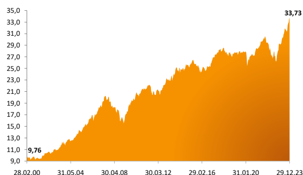
Rys.2 Wykres wartości jednostki rozrachunkowej PFE Nowy Świat

Założono: - średnioroczną stopę zwrotu Funduszu 5% - wielkość comiesięcznej składki dodatkowej 50 PLN lub 100 PLN